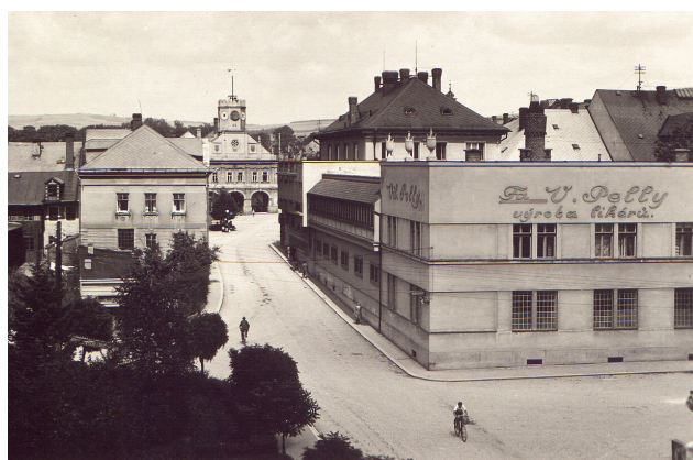
Pellyho továrna na jemné likéry – pohled od Bezděčkova parku

Narodil se 20. 12. 1849 v Polici nad Metují v rodině mlynáře. V Novém Městě nad Metují se vyučil kupeckým příručím a zde si také osvojil znalosti o výrobě likérů. Roku 1870 získal od otce dům na polickém náměstí, ve kterém založil vlastní výrobu lihovin. Díky „suchodolským zázrakům“ nashromáždil brzy značné jmění a roku 1895 začal i s textilním podnikáním. V Polici vybudoval velkou přádelnu bavlny, kterou později doplnil také o tkalcovnu, barevnu, bělidlo a šlichtovnu. Zemřel 26. března 1939 ve věku devadesáti let.