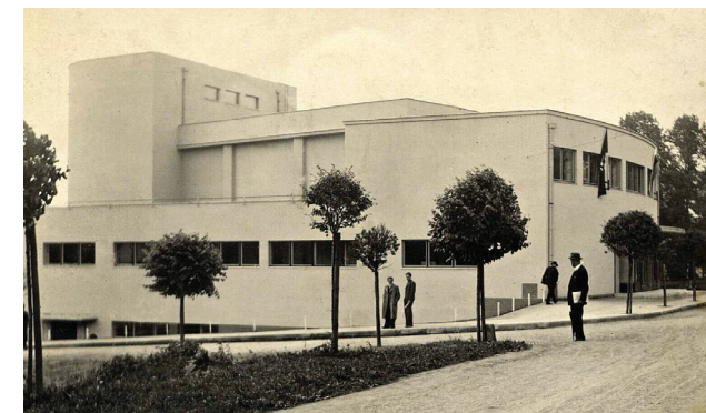
Budova Kolárova divadla z roku 1940, na jejíž stavbu Pelly daroval desetitisíce cihel